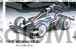
1868 KEEN NAJIN Jr. キーンナジンJr.