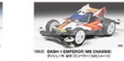
1865 DASH-1 EMPEROR (MS CHASSIS) ダッシュ1号 1号(シロアリ)MSシャシ