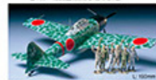
0125 MITSUBISHI A6M3 TYPE 52 ZERO FIGHTER (HAMPI) (1/48) L. 30mm