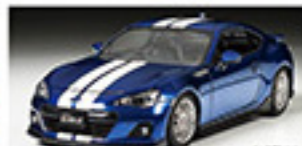
24206 SUBARU BRZ STREET-CUSTOM SUBARU BRZ STREET-CUSTOM