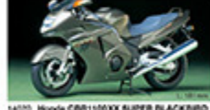
14070 Honda CBR1100XX SUPER BLACKBIRD ホンダ CBR1100XX スーパーブラックバード L. 160mm