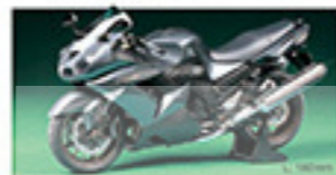
14111 Kawasaki ZZR1400 カワサキ ZZR1400 L. 160mm