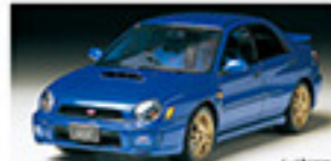
24201 SUBARU IMPREZA WRX STI SUBARU IMPREZA WRX STI