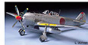
0113 NAKAJIMA KI-64 SA (FRANK) (1/48) L. 30mm