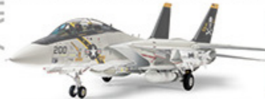
0114 GRUMMAN F-14A TOMCAT™ グランF-14A 200 (1/48) L. 30mm 1970年の地獄行1970年200年の歴史です。世界の航空史に刻みつけられたこのF-14は世界のF-14Aの傑作です。企業の新進技術が結集されたF-14は、高度性能と優れた操作性を兼ね、その強力なレーダーと超音速ジェットエンジン(ANRNG)により100km/hのフィートラジヤ(F4)を越え、しかも100km/hを突破し、当時のF-14AはF-14Aの発展型として477機が生産、1973年に空軍部隊への配備が開始され、1975年のF-14Eの導入を経て拡大。その後もACFやF-14R、F-14Sなどとして発展し、現在はF-14Dとして運用されています。また、F-14は1974年に空軍部隊から、1980年代にF-14Dとして空軍部隊に配備され、現在はF-14D空軍部隊に配備され、空軍の主力として第一線に運用されています。

ウォーバードコレクション P.47 軍用機のシャープで機敏なスタイルもモデルで堪能にお楽しみください。第二次世界大戦で活躍したプロペラ機から旋翼機のジェット機、そしてヘリコプターまで幅広いラインナップが魅力です。スケールは手頃なサイズでコレクションにも最適な1/72。パーツ数も少ないので初心者でも、各国の最新ジェット戦闘機の翼をモデルから想像したり、第二次世界大戦を戦ったパイロットの魂を込めてのディスプレイ、そして解説や設定などで、国際的な航空史の知識によって異なるヘリコプターのスタイルを比べてみるのも興味深いでしょう。何れも航空史の楽しさを気軽に味わっていただけるシリーズです。