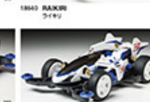
1864 SHOOTING PROUD STAR シューティングプロウドスター