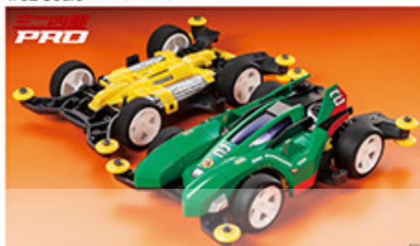
1864 GOO BURNING SUN ゴウバーニングサン