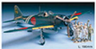
0127 MITSUBISHI A6M5c TYPE 52 ZERO FIGHTER (ZEKE) (1/48) L. 30mm