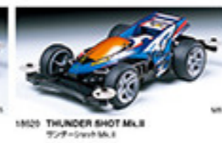
1860 THUNDER SHOT M.L.R. サンダーショット M.L.R.