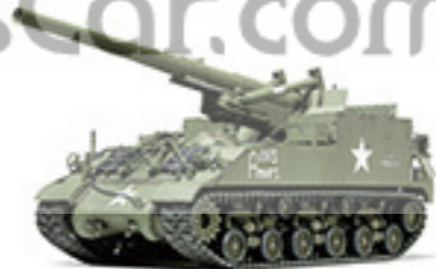
36301 U.S. SELF-PROPELLED 155mm GUN M40

コンパクトなサイズと大型モデルに迫る絶景再現が魅力。各国の戦車や装甲車種、大砲の統一スケールでモデル化するシリーズです。キューベスワグンで全長約80cm、タイヤ1個あたり長さ約15cmの小型モデルですが、プロポーションやディテールの良さと1/48スケールシリーズにも引けありません。顔面造形もリアルに再現してやまらぬ造形。兵士の人形セットやアクセサリーパーツと組み合わせて、臨場感あふれる情景作りも楽しめます。また飛行機モデルの収納スペースとして対応する1/48スケール向けに、1/48飛行機シリーズに豊富に揃った飛行機と組み合わせて、これまでにない情景が広がることでしょう。