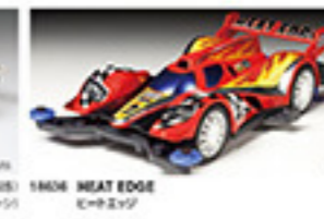
1866 HEAT EDGE ヒートエッジ