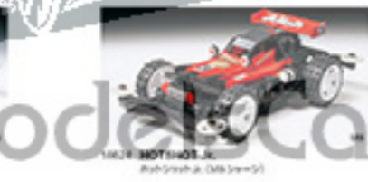
1862 HOT SHOTS Jr. ホットショットJr.(ダブルバネ)