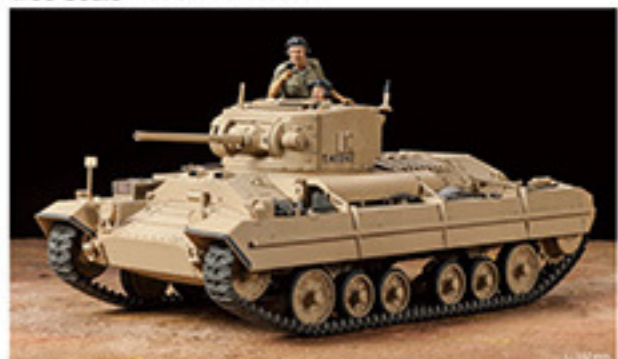
36302 BRITISH INFANTRY TANK M4B1 VALENTINE M4B1V