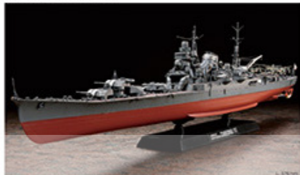
7007 JAPANESE HEAVY CRUISER CHIKUMA 01886 1/350