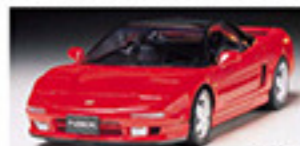
24100 Honda NSX Honda NSX