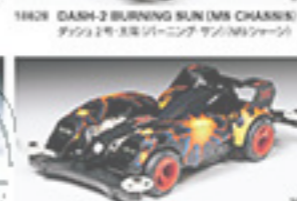
1865 TRIGGER XX トリガーXX(ダブルバネ)