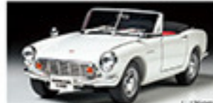
24340 Honda S600 Honda S600