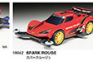
1862 SPARK ROUGE スパークルージュ