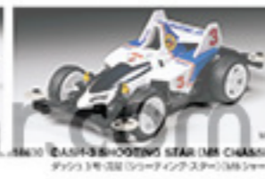
1863 DASH-3 SHOOTING STAR (MR CHASSIS) ダッシュ3号 3号(シロアリシャシ)MRシャシ