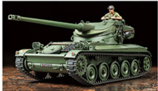
36305 FRENCH LIGHT TANK AMX-13