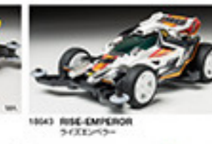
1863 RISE-EMPEROR ライズエンペラー