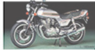
14100 Honda CB750F ホンダ CB750F L. 160mm