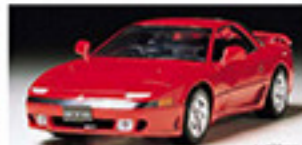
24216 MITSUBISHI GTO TWIN TURBO 三菱 GTO ツインターボ