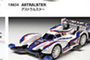
1865 BLAST ARROW ブラストアロー