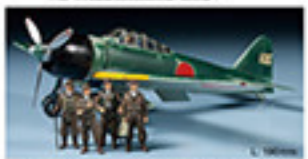
0118 MITSUBISHI A6M3a ZERO FIGHTER (ZEKE) (1/48) L. 30mm