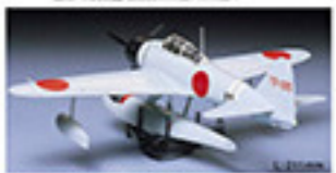
0117 NISHIKORUSEN (RUFO) (1/48) L. 30mm