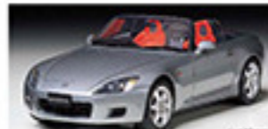
24211 Honda S2000 Honda S2000