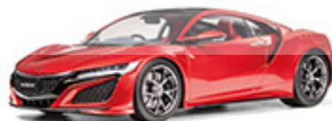
2434 NSX NSX

実物のマシンが作りこまれていることと同じく再現されているのは本格的な精密スケールモデルです。車庫の数は300から500前後、サスペンションやスタビライザーシステムなど実車のディテールまで再現。細部までリアルに再現されたエンジンとボディカラーを裏面にパズルで交換。配置の自由度は十分。さらにモデルの仕上げにこだわったエッチングパーツや全量製作パーツもセットしました。ボディカラーは11色で実車を臨んだ詳細なモデル化は、まさにベテランモデラーの得意を磨くにも最適な内容です。