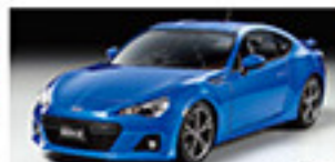
24204 SUBARU BRZ SUBARU BRZ