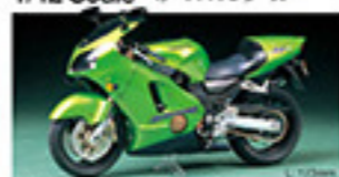
14104 Kawasaki Ninja ZX-12R カワサキ Ninja ZX-12R L. 170mm