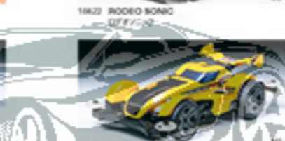
1869 SAYONARA LEO サヨナラレオ