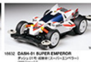
1862 DASH-01 SUPER EMPEROR ダッシュ01号 01号(シロアリ)MSシャシ