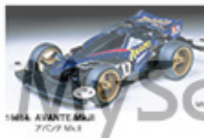
1864 AVANTE M.L.R. アヴァンテ M.L.R.