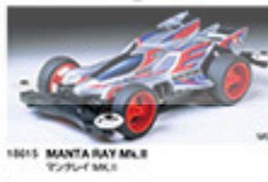
1865 MANTA RAY M.L.R. マンタレイ M.L.R.