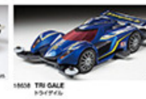
1868 TRI GALE トライゲイル