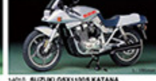
14010 SUZUKI GSX1100S KATANA スズキ GSX1100S L. 170mm