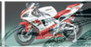
14072 YAMAHA YZF-R1 ヤマハ YZF-R1 L. 170mm