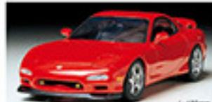
24115 MAZDA RX-7 R1 マツダ RX-7 R1