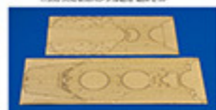
12045 1/350 SCALE JAPANESE BATTLESHIP YAMATO DECK SHEET 1/350 01886 1/350 01886