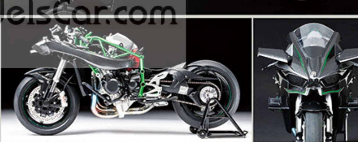
14121 Kawasaki Ninja H2R カワサキ Ninja H2R