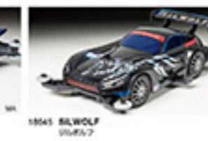
1864 SILWOLF シルウルフ