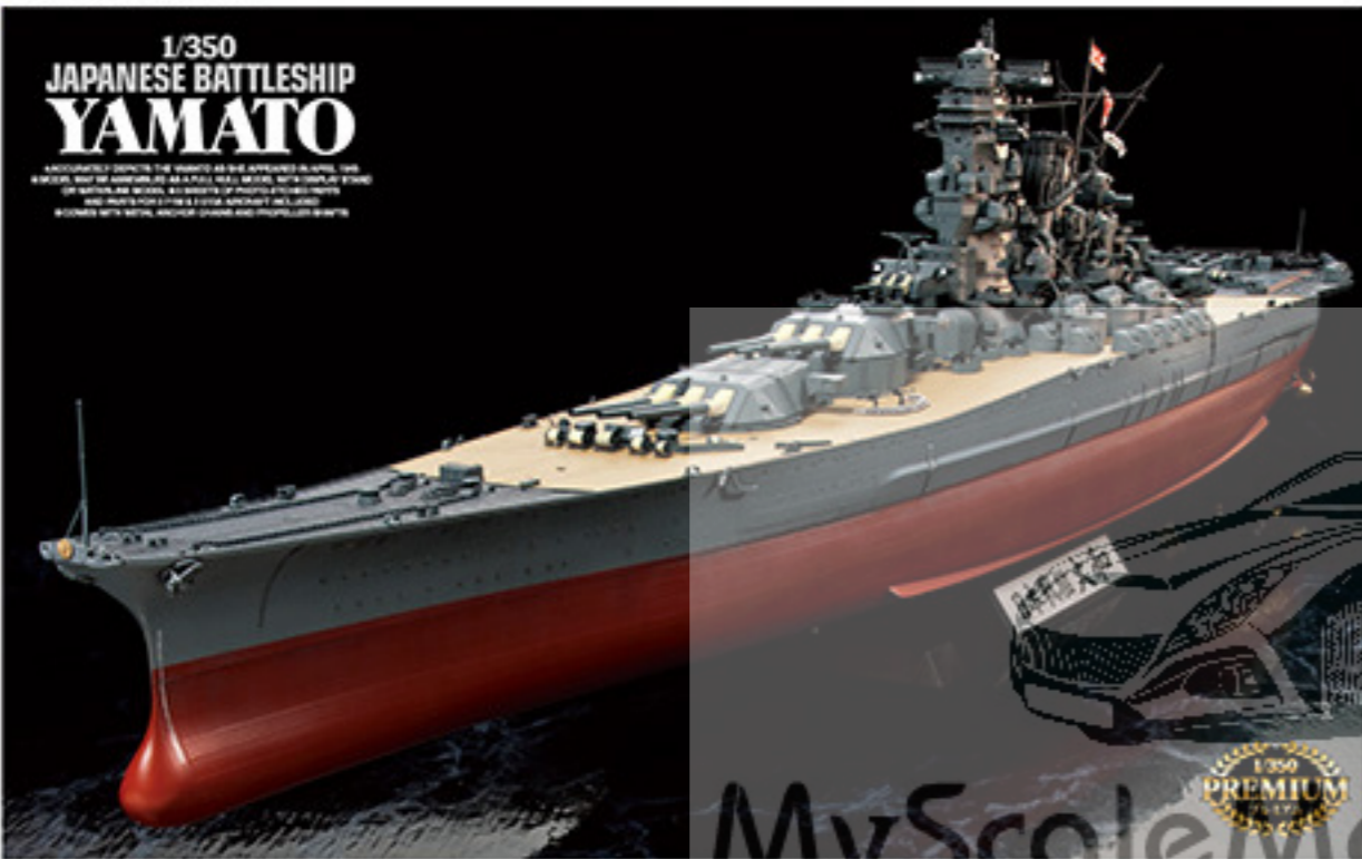
7006 JAPANESE BATTLESHIP YAMATO 01886 1/350

EXCLUSIVELY DEPICTS THE YAMATO AS SHE APPEARED IN 1941. THE BRIGADE, MAY BE ASSEMBLED AS A FULL METAL KIT OR DISPLAY STAND. THE MAIN DECK, ALL DECKS, ALL MASTS, ALL MOUNTS, ALL GUNS AND MAIN MASTS ARE ALL METAL. THE AIRCRAFT CARRIERS ARE MADE WITH METAL. AIRCRAFT, GUNS AND PROPELLER BLADES.