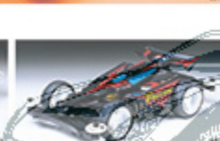
1867 NEO FALCON ネオファルコン