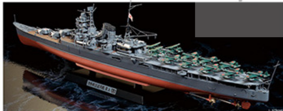
7001 JAPANESE AIRCRAFT CARRYING CRUISER MOGAMI 01886 1/350