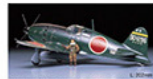
0108 MITSUBISHI J2M3 INTERCEPTOR RAIDEN (JACK) (1/48) L. 30mm