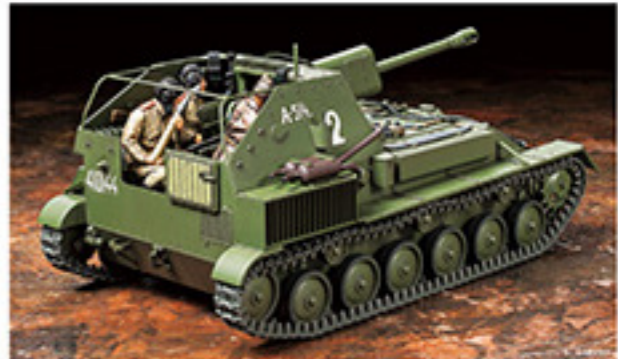
36304 RUSSIAN SELF-PROPELLED GUN SU-76M