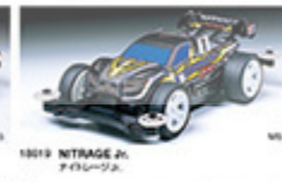
1869 NITRAGE Jr. ニトレッジJr.