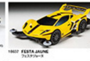
1867 FESTA JAUNE フェスタジャンヌ