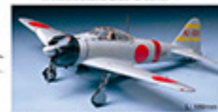
0106 MITSUBISHI A6M2 TYPE 21 ZERO FIGHTER (ZEKE) (1/48) L. 30mm