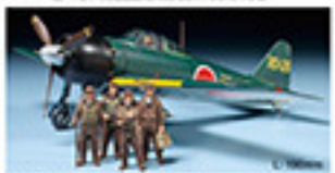
0110 MITSUBISHI A6M5a ZERO FIGHTER (ZEKE) (1/48) L. 30mm