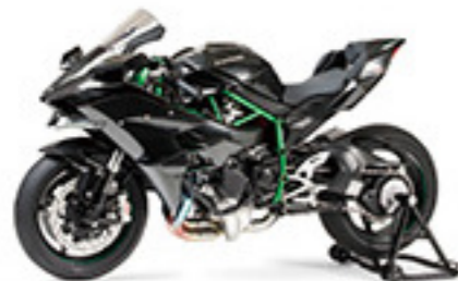
14121 Kawasaki Ninja H2R カワサキ Ninja H2R L. 210mm 2014年のケルンシリーズでデビューし、今後の展開を想定したのがケルンシリーズの33コーストモデル、Ninja H2Rです。誰も想像したことのない加速力の傑作！を実現する600cc、過心式スーパーチャージャーを搭載して300馬力オーバーの最高出力を発揮する。開発者の信念を100cc未満の4気筒エンジンを駆動するスーパーチャージャーに託す。また、クワンロジック上部とサイドポッドにカーボン製のウイングを装着して高速走行時の安定性を確保。さらに、クワンロジックと40ccスーパーチャージャーを駆動する最新のバリエーションは、片側車主要の技術を集約したスーパーバイクです。

大型スケールモデルの面白さをお楽しみください。モーターのメカニズムを持つオートバイの魅力をおのまかにモデル化したシリーズです。空冷エンジンならではの繊細な表情を見せる冷却ファン、キャブレターなどの機構もメカニカルなエンジンの再現を目的に、フレームからスイングに至るまでリアルな表現はきっちりと満足いただけるでしょう。コイルスプリングと金属パイプで構成される可動式のサスペンション、金属製シートの手触り感など、シリーズの各モデルともに金属部品、合成ゴム部品を豊富に使って質感、強度ともに十分。プラスチック部品にもクロームメッキ、ツヤ黒メッキが施されて仕上げは抜群。作りこみ、見ごたえともにトップクラスの大型モデルシリーズです。