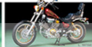
14044 YAMAHA XV1000 VIRAGO ヤマハ XV1000 CT-3 L. 160mm