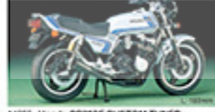
14106 Honda CB750F CUSTOM TUNED ホンダ CB750F カスタムチューン L. 160mm