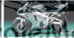
14064 YAMAHA YZF-R125RACING ヤマハ YZF-R125R L. 125mm