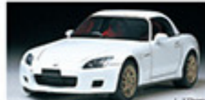
24215 Honda S2000 Honda S2000