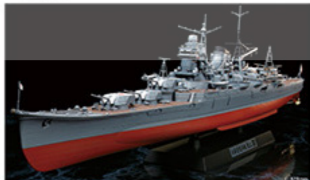
7002 JAPANESE HEAVY CRUISER MOGAMI 01886 1/350