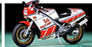
14037 YAMAHA RZV500R ヤマハ RZV500R L. 170mm