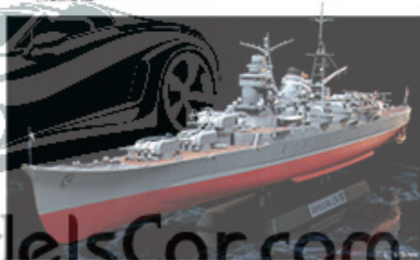
7008 JAPANESE LIGHT CRUISER SAKAUMA 01886 1/350