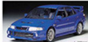
24213 MITSUBISHI LANCER EVOLUTION VI 三菱 ランサー エボリューションVI