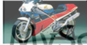
14102 Honda VFR800R ホンダ VFR800R L. 160mm