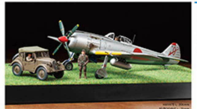
0115 NAKAJIMA HAYATE / FRANK & KUROGANE SCENERY SET (1/48) L. 30mm