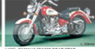
14080 YAMAHA XV1000 ROAD STAR ヤマハ XV1000 D-937 L. 160mm