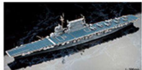
21170 U.S. AIRCRAFT CARRIER CV-3 SARATOGA PONTON MODEL DETAIL UP PARTS 70000 1/700 01886 1/700 01886