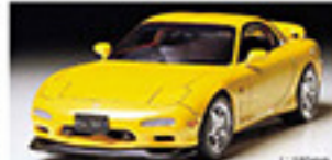
24110 Mazda RX-7 マツダ RX-7