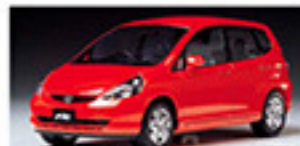
24201 Honda Fit Honda Fit